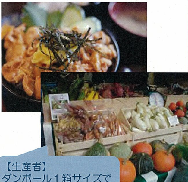
【生産者】 ダンボール1箱サイズで 道産食材を輸出したい