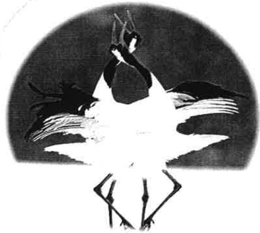
鶴居村：タンチョウ