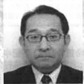
農林水産省 農村振興局長