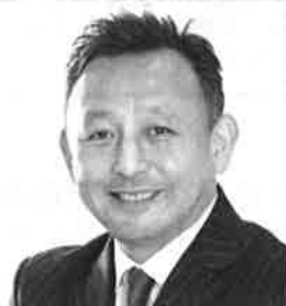
(株)百戦錬磨 代表取締役社長