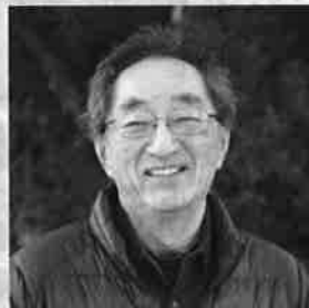
NPO法人北海道ツーリ ズム協会理事長