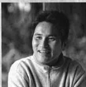
長野県茅野市観光 まちづくり推進室長