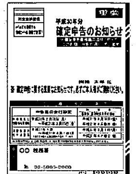
「確定申告のお知らせ」はがきイメージ

※「確定申告のお知らせ」はがきとは、予定納税額などの申告書の作成に必要な情報を記載したはがき（又は封書）です。